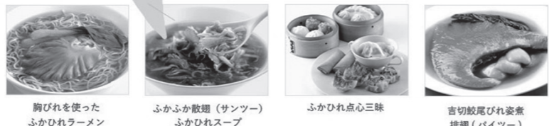
株式会社「中華・高橋」のホームページより

フカヒレの取扱量、ボリュームで 当社が日本一ということになりま す。東京都内の高級中華料理の専 門店・レストランに限ると、シェ アは40%ほどです。